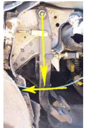
Kuvan autossa poljin liikkuu vaakasuorassa, jolloin vaijerin kiinnike polkimessa ja haarukkaliitin rintapellissä ovat samalla tasolla.

Oplu -polkimessa vaijerin suurin mahdollinen liike on 60 mm. Vaijerin kiinnikkeet asennetaan kuljettajan jarrupolkimen varteen kohdalle, jossa liike on jarrua painettaessa alle 50 mm. Liike mitataan auton olleessa käynnissä jarrutehostimen toimiessa. Jos kiinnikkeet eivät sovi jarrupolkimen varteen, ne on muotoiltava sopiviksi tai kiinnitys on tehtävä muulla tavalla. Rintapeltiin porataan 6mm:n reikä siten että vaijeri liikerata tulee polkimen liikeradan suuntaiseksi. Reiän paikkaa määritettäessä on tärkeätä seurata jarrupolkimen liikkeen suuntaa eikä varren suuntaa. Haarukkapää kiinnitetään reikään pultilla. Eräissä autoissa on mahdollista kiinnittää jarrupolkimen kiinnityspultteihin rauta haarukkapäätä varten. Silloin ei tarvita reikää auton rintapeltiin.