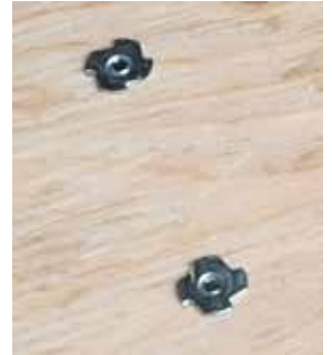
Lyöntimutterit vanerin alapuolella.

Ensimmäiseksi kiinnitetään liukuestetarra ja vaijerilukko keltaiseen polkimeen. Sitten polkimen mustat osat yhdistetään liu'un kohdalla lyhyellä lukkoruuvilla. Noin 10mm:n vahvuisesta vanerista leikataan auton jalkatilaan sopiva palanen. Vaneri asetetaan jalkatilaan ja poljin sovitetaan paikalleen taivuttamalla polkimen kulmaa ja säätämällä runko-osan pituutta. Tarvittaessa polkimen kaltevuutta voidaan lisätä laittamalla kärkiosan alle puinen tukipala. Vaijerilla on oltava tilaa kääntyä polkimen yläpuolella. Sovituksen lopuksi vaneriin merkitään kiinnitysreikien paikat ja porataan reiät 8 millimetrin poralla. Lyöntimutterit lyödään vanerin ALAPUOLELLE. Poljin kiinnitetään ruuveilla paikoilleen. Vaneri kiinnitetään esimerkiksi lattaraudalla etuistuimen kiinnityspultteihin. Kiinnitystä on vaadittu ajokokeessa.